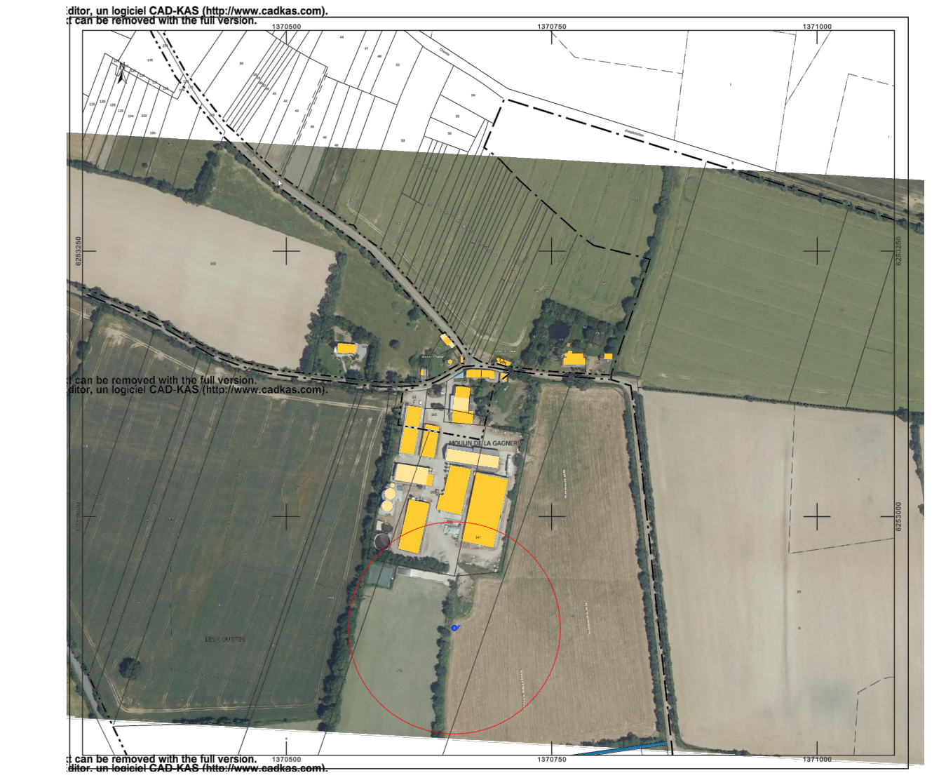
- EXTRAIT CADASTRAL - Section YA - ECH : 1:5000